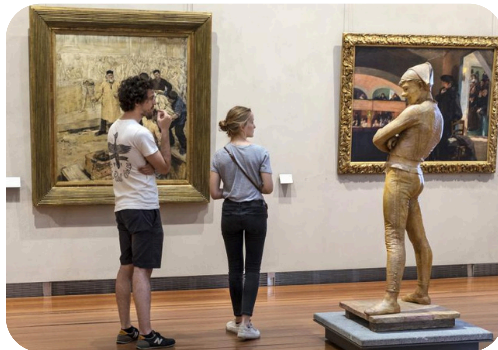
MUSÉE DES BEAUX-ARTS DE LYON

Échangez avec des professionnel·le·s de la médiation culturelle et de l'accessibilité, qui partageront des solutions concrètes et des initiatives mises en place dans leurs musées pour favoriser l'inclusion de tous les publics.